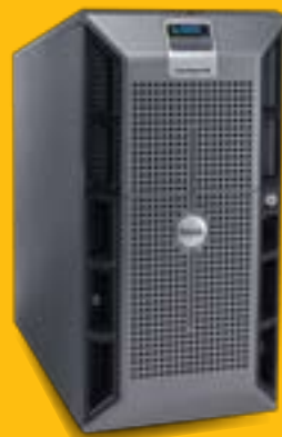
SERVICIO DE SOPORTE PROFESIONAL DE T.I.