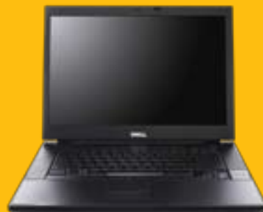
SOPORTE A USUARIO FINAL