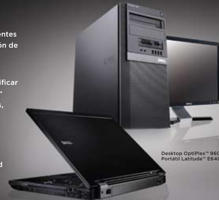
Desktop OptiPlex™ 960 y Portátil Latitude™ E6400

INTEL® CORE™2 CON TECNOLOGÍA VPRO™ Intel® Centrino™2 con tecnología de procesador representa un salto adelante en la conectividad inalámbrica, vida de la batería y rendimiento, lo cual le permite mantenerse móvil y productivo durante mucho más tiempo.